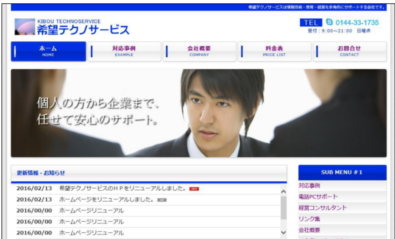
写真 7 PC での見え方

と部品のサイズや配置が最適化され、見やすくなるのが分かります。この時の見え方の変化を画像に撮ったものが以下の写真 7~9 です。